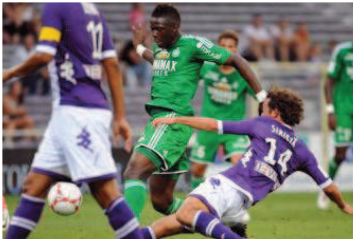
SPORTS ■ Sako et les Verts pris au piège toulousain.

Deux matches, deux défaites. Après s'être inclinés face à Lille dans le Chaudron, les Stéphanois ont été à nouveau battus, hier soir, à Toulouse, sur le même score. Hier, les Sudistes ont dominé les débats malgré le retour des Verts dans les dernières minutes de la rencontre.